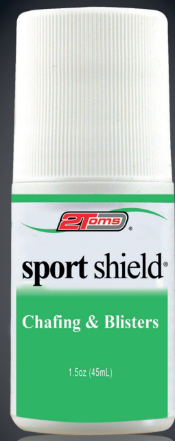
2Toms ® sport shield ® Chafing & Blisters 1.5oz (45mL)

100 % Verlässlichkeit ■ schmilzt nicht ■ hält den ganzen Tag